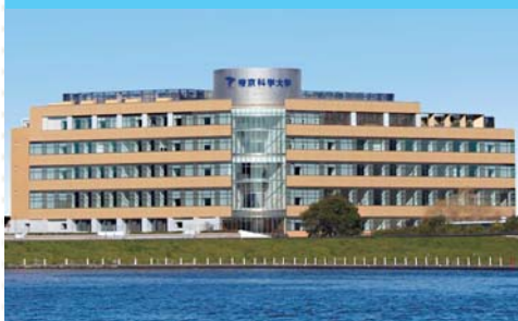
本館 大教室やカフェテリアがあります。