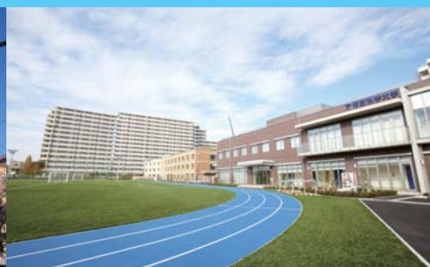
グラウンド 全面人工芝で様々なスポーツが行えます。