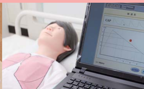
フィジカルアセスメント 人間の体や病気を学びます。