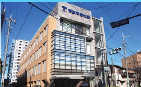
2号館 最上階にはアリーナ、地下1階には小アリーナがあります。