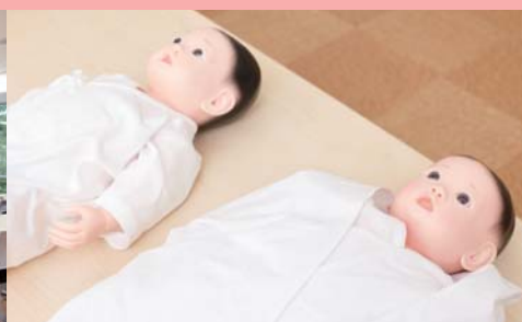
モデル人形(乳児) 乳児の看護を学びます。