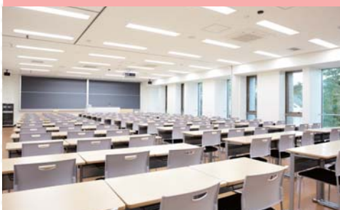
2号館 教室 看護学科の学生は主にこちらで受講します。