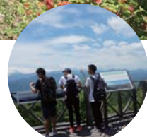
山頂付近の展望台

都心からのアクセスが良く、五感をテーマにしたルートが人気。季節ならではの花々、鳥のさえずり、野生の小動物の足跡など、たくさんの発見が待っています。