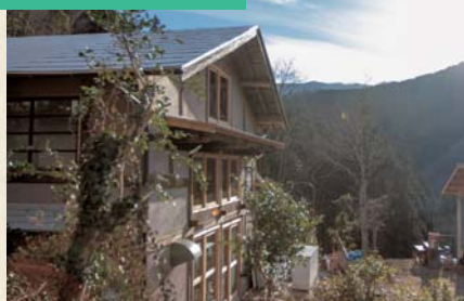
ワークショップ型でオーナー夫妻が再生させた古民家

2016年末に上野原市西原にOPEN! 築150年の古民家宿「したで」に泊まろう!