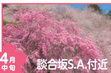
4月中旬 談合坂S.A.付近