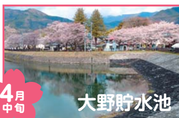
4月中旬 大野貯水池