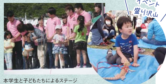
本学生と子どもたちによるステージ

地域活性を目的にボランティアが集まる、みんなが主役の交流の祭典! 本学の学生たちも、地元の子もたちとダンスをしたり、動物ふれあいブースを出展したりするなど積極的に参加しています。この機会にぜひご参加ください!