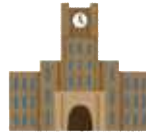
学校種 国公立／私立