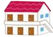
自宅通学／自宅外通学