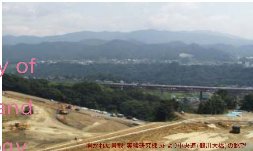
開かれた景観・実験研究棟 5Fより中央道(鶴川大橋)の眺望