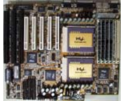
数百個の部品からなるコンピューターの基盤

その1例がシステムの評価問題である。システムを設計する時にシステムに要求されている能力や性能が満たされているかどうかを評価することが必要とされるが、システムを構成する個々の部品の性能はわかっているとしてもそれらの部品でできあがったシステム全体の性能が果たしてシステムに求められている性能を満たしているかどうかはわからないというのがこの問題の核心である。ここにコンピューターのネットワークシステムがある。インターネットはこのコンピューターのネットワークシステムの大規模なものである。ネットワークを構成するコンピューターの処理性能、あるコンピューターから別のコンピューターへの通信能力はわかっているとして、ネットワーク全体としての性能は実際にシステムを作りあげてみないとわからないのが現実の世界である。実際にシステムを作ってから評価し、ダメな場合には作り直すとコストや時間がかかってしまい無駄となる。そこで作り上げようとするシステムの性能を事前に推測することが重要となる。