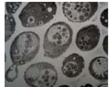
酵母の透過型電子顕微鏡像 (自食作用で液胞に細胞の中身を取り込んだ球状の構造体が見える。)

私のもう1つの大きなテーマは酵母と抗生物質の関係である。酵母は比較的安全な微生物だが、手術後などで体力が落ちている状態で人に感染し、重篤な症状をもたらす酵母がいる。酵母細胞はヒトと同じ仕組みを持つことから酵母を抗生物質でやっつけようとする、ヒトの細胞もやられてしまい、困ったことになる。そこで私達は細菌に効く抗生物質がなぜ酵母に効かないのか？ 酵母はどのようにして抗生物質に対して抵抗性になるのかということをはっきりと明らかにし、ヒトと同じ仕組みを持つ生物の感染にどのようにして抗生物質を作用させたらよいのかを解明したいと考えている。酵母の細胞の仕組みを明らかにすることからガン遺伝子やヒトの遺伝病の解析の糸口が開かれてきた。小さな生き物から大きなテーマを産み出すこそバイオ研究の醍醐味であろう。