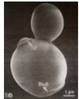
酵母の走査型電子顕微鏡像 (出芽している娘細胞)

酵母はメソポタミアやエジプトで 5000 年前からビールやパンの製造に使われ、清酒、味噌、醤油さらに漬物の製造など日本人の食生活にとってもなくてはならぬ微生物である。この酵母は微生物といっても大腸菌のような簡単なものではなく、われわれヒトなどの動物や植物の細胞と基本的に同じ仕組みを持つ高等生物である。その違いはヒトが約 60 兆個の細胞からできているのに対し、酵母はたった1つの細胞からなるということである。しかしこの 1 つの細胞の中で、ヒトや高等植物などで行われているのと同じ命の営みが行われており、酵母によって解き明かされた知識でヒトなどの命の仕組みの一端を理解することができる。その意味で酵母はモデル生物といわれ、私はこの酵母について「環境応答 生物が環境の変化にどのように対応していくのか」を研究テーマとしている。