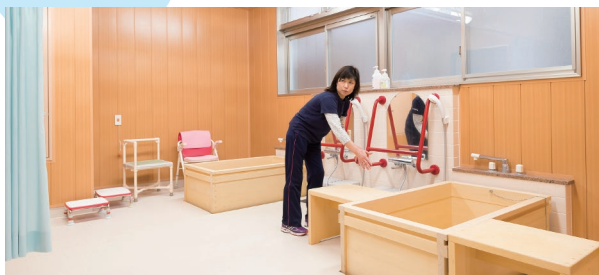
特別養護老人ホーム「桃源荘」

帝京福祉専門学校は、全国に先駆けて設立した介護福祉士養成校。今日まで国家資格とともに歩んだ歴史と実績、信用により、数多くの施設に卒業生を輩出し、実習先も多様かつ豊富です。