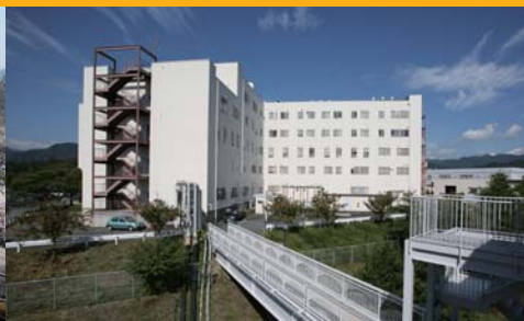
実験研究棟 調理実習室やピアノレッスン室があります。