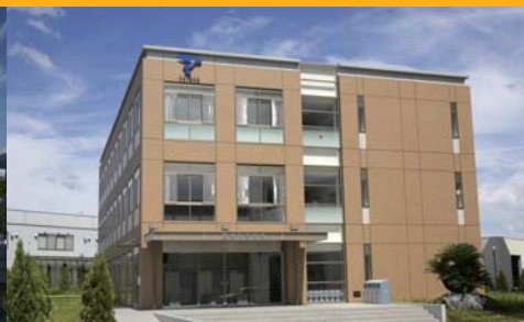
医療科学部棟 医療科学部の学生が学びます。