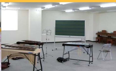
音楽室 保育に必要な様々な演奏技術の実習を行います。