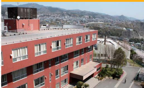
本館棟 大教室やマルチメディア教室があります。