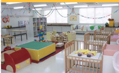
保育実習室 沐浴やトイレ設備、ベビーベッドなどがあります。