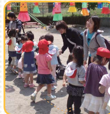
保育園での行事に参加