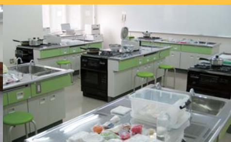
調理実習室 乳児のミルク、離乳食、幼児の食事を作る実習等を行います。